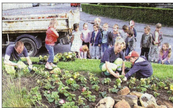
Des jardiniers en herbe

Ces distinctions sont la récompense de tous les acteurs de l'embellissement de la commune : services techniques de la ville, associations concernées, et surtout les nombreux particuliers soucieux de l'image de marque de notre cité.