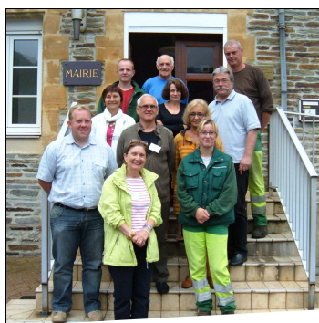
Le jury régional