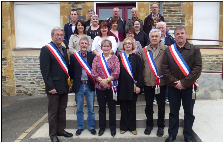
Le nouveau Conseil Municipal