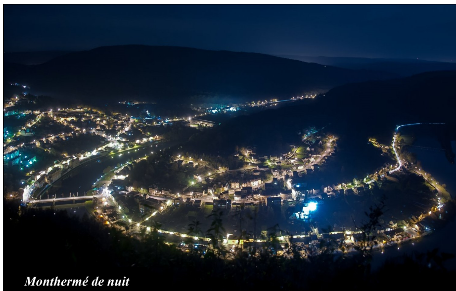
Monthermé de nuit

Remise de médailles Remerciements La nouvelle carte cantonale