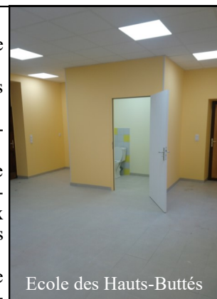
Ecole des Hauts-Buttés

Un cabinet d'architecte travaille actuellement sur la mise en accessibilité de la salle des fêtes, du foyer des anciens et de la Maison du Peuple.