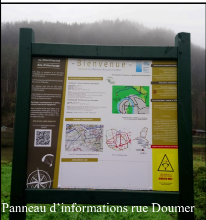
Panneau d'informations rue Doumer

Ces panneaux permettent de diffuser les messages de sécurité, la présence ou non des faucons pèlerins aux abords des sites d'envol afin que tout le monde trouve sa place.