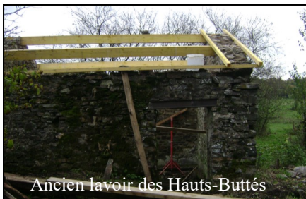
Ancien lavoir des Hauts-Buttés

Création d'un cheminement d'accès aux toilettes des Hauts-Buttés.